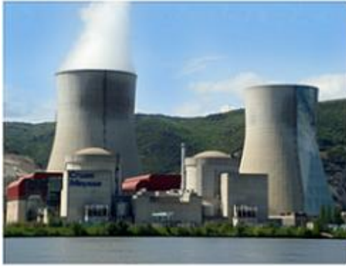
Centrale de Cruas Meysse, Ardèche