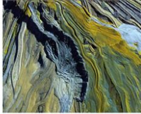
Mine d'uranium au Niger