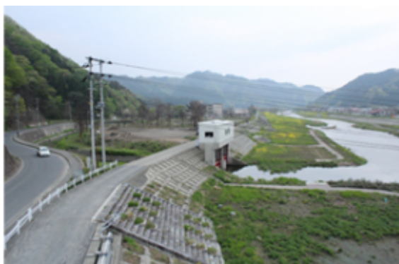
Avant et après l'enlèvement des gravats © Ville de Ôtsuchi (département d'Iwate)

Pour accélérer le traitement, le département d'Iwate a mis en place deux incinérateurs provisoires. Le département de Miyagi a prévu d'en construire 29 dont sept sont déjà opérationnels aujourd'hui. La gestion des déchets relève de la compétence des communes mais, face à l'ampleur de la tâche, ce sont les départements qui opèrent pour le compte de la majorité de leurs communes. Cependant, la capacité de traitement des installations étant largement inférieure au volume total de déchets, leur élimination intégrale avant l'échéance de mars 2014 ne sera possible que si une partie (0,57 million de tonnes pour Iwate et 3,44 millions de tonnes pour Miyagi) est incinérée et enfouie en dehors des départements sinistrés. Cette gestion des déchets à l'échelle nationale est jugée d'autant plus urgente et indispensable que leur stockage dans des dépôts provisoires n'est pas sans conséquence sur l'environnement et la santé de la population (risque d'incendie, odeur, prolifération de mouches, pollution des sols...). Un tel traitement national permettra en outre d'accélérer la reconstruction de certaines communes, empêchée par l'accumulation de trop nombreux débris.