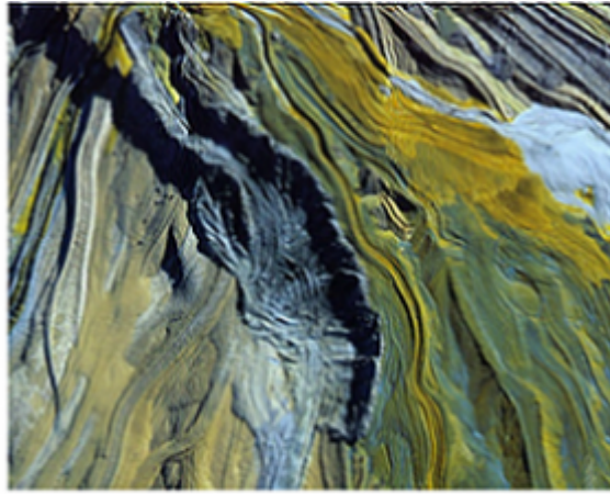
Mine d'uranium au Niger