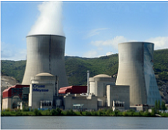
Centrale de Cruas Meysse, Ardèche