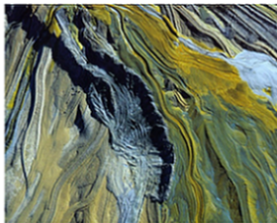
Mine d'uranium au Niger