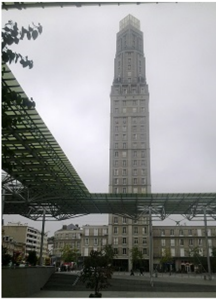
Amiens : La tour Perret

Dans son cahier d'intention « Développer la mixité des fonctions et préserver le patrimoine naturel dans les nouvelles campagnes » [37], la directive régionale d'aménagement (DRA) incite à expérimenter des solutions pour l'aménagement des espaces à revaloriser mais également à trouver des outils pour la gestion des espaces vécus. La Région est maintenant engagée dans la préparation du prochain Programme de Développement Rural Régional 2014-2020.