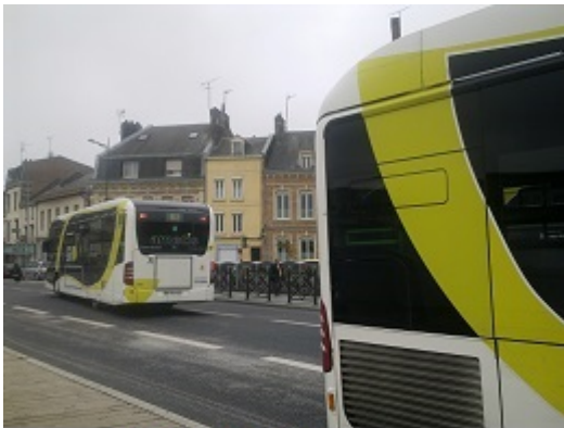
Amiens : les bus

Tandis que les villes de Picardie se dépeuplent, la population de ses villages et bourgs augmente, les habitants sont alors contraints à de longs déplacements, de 4 à 5 km plus importants qu'ailleurs.