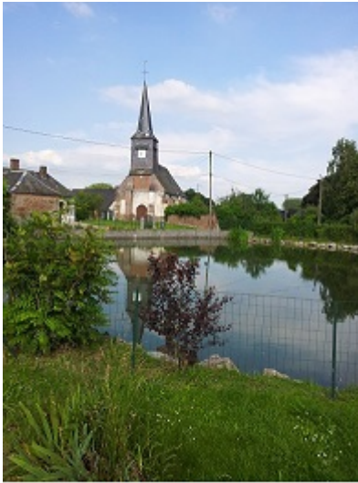
Village picard autour de sa mare

Sans oublier, d'autres réseaux comme les grands couloirs biologiques qui tissent des liens denses avec les régions voisines ou encore celui des véloroutes et voies vertes qui offrent un tourisme différent. Cela se traduit dans les partenariats économiques nombreux, en particulier avec la région Nord-Pas-de-Calais.