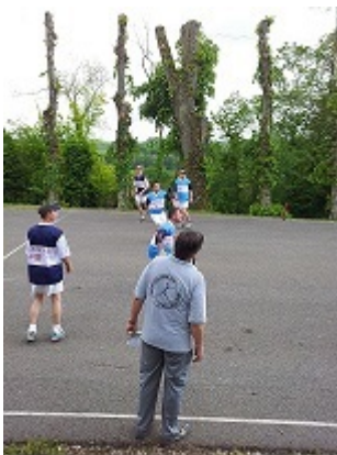
Ballon au poing

Tirillée entre les deux grandes zones urbanisées du Nord-Pas-de-Calais et de l'Île-de-France, coupée socialement en deux parties, la première au sud relativement riche et la seconde au nord paupérisée, la Picardie rassemble trois départements aux identités contrastées, l'Aisne, l'Oise et la Somme. Toutefois, la culture, la langue et l'esprit picards [1] demeurent bien vivants. En témoignent les rèderies [2] couplées aux fêtes de village et la pratique de sports tels le ballon au poing,