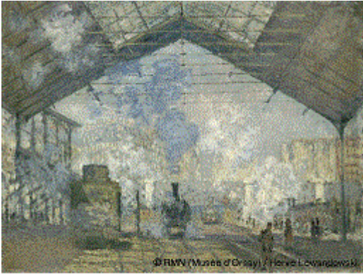
Claude Monet: La gare St Lazare Musée d'Orsay

En moins d'un siècle, on a assisté au passage d'une société rurale à une société industrielle et à dominante urbaine. Les conséquences de cette énorme mutation ont été innombrables et ont concerné tous les rouages de la vie économique, sociale, culturelle, artistique, politique : les sciences (Claude Bernard, L'introduction à l'étude de la médecine expérimentale , Darwin, De l'origine des espèces , Pasteur...) et les techniques, la révolution de l'énergie avec le charbon et la vapeur et plus tard l'électricité, les transports (avec le développement des chemins de fer), l'organisation de la production industrielle (la naissance de l'entreprise), l'urbanisation, la philosophie (Hegel, Marx et Engels, Tocqueville, Saint Simon, Proudhon, Fourier...), la littérature (Dickens, Chateaubriand, Zola, Hugo, Balzac...), l'art, la vie sociale, le développement de la classe ouvrière et la prise de conscience de son exploitation, les mœurs, la famille, la religion, la politique avec les différents mouvements révolutionnaires qui ont accompagnés l'histoire du XIXe siècle et la première partie du XXe siècle (les révolutions de 1830 et de 1848, La Commune de Paris, la Révolution d'octobre...).