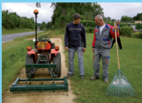
La Plourasette®, aujourd'hui brevetée, a été conçue par les agents de Plouër-sur-Rance pour un traitement mécanique des espaces verts en remplacement des produits phytosanitaires.