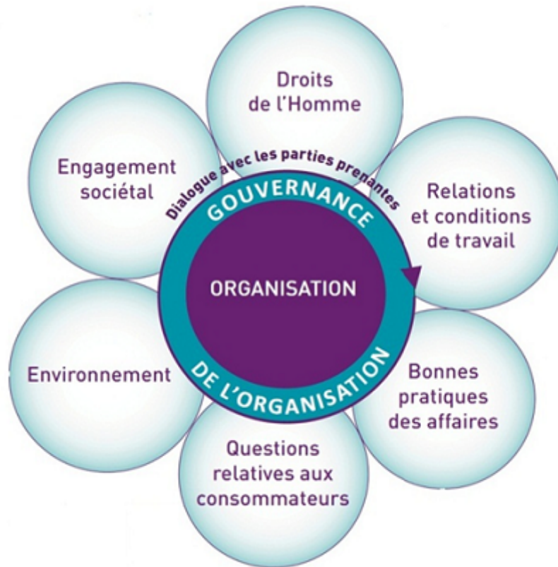
Fig. 2 - Norme ISO 26000 : les 7 domaines d'actions

Le dialogue social pourrait en être profondément modifié tant en interne de l'entreprise, qu'en externe, avec les acteurs du territoire.