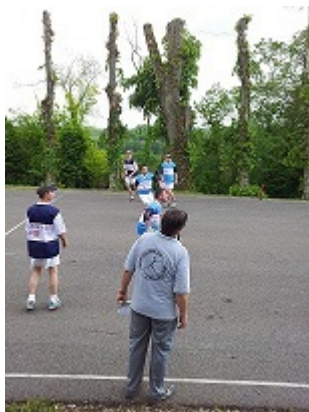
Ballon au poing

la longue paume, le javelot tir-sur-cible ou la course attelée. La promotion d'une culture régionale est l'élément-clé de la stratégie du Comité régional du tourisme à travers sa revue « Esprit de Picardie » et son appropriation par tous, servie par la mise en ligne en 2008, à l'initiative du Conseil régional, de l'encyclopédie picarde, wiki régional de la culture picarde.