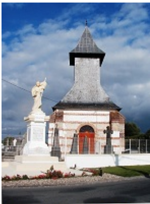
Picardie, terre de mémoire

L'état des ressources en eau (cours d'eau, zones humides, nappes phréatiques souterraines) constaté à ce jour est tel, suite aux pollutions d'origine diverse, agricole, domestique, industrielle..., que l'objectif du « bon état » de la ressource fixé par la DCE, directive-cadre sur l'eau, ne sera pas atteint en 2015 et que l'Etat français devra en demander le report pour 2021 voire 2027 pour certaines ressources.