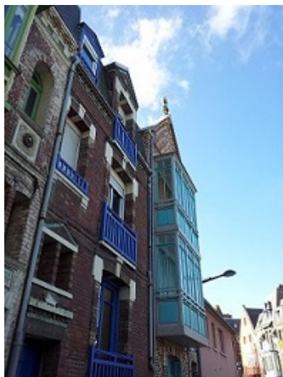
Mers les Bains

En 2009, la Picardie est la 18ème région française en termes de nuitées sur la période d'été. Toutefois, mesuré en emplois, le poids du tourisme, 22300 emplois dont 18000 salariés, équivaut à celui des trois principaux secteurs industriels de Picardie réunis, soit les secteurs du caoutchouc et des plastiques, de la métallurgie, des denrées alimentaires.