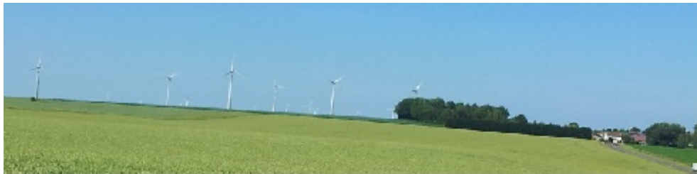
Agriculture et Eoliennes

Ventée, relativement peu peuplée, la Picardie est avec 1700 MW accordés dont 756 en service, la première région française, en 2011, pour la production éolienne d'électricité. Les ressources de biomasse ligneuse (bois, essentiellement des sous-produits non commercialisables d'exploitations forestières ou d'espaces verts, et paille) alimentent 35 chaufferies collectives. Des ressources forestières supplémentaires existent en matière de feuillus.