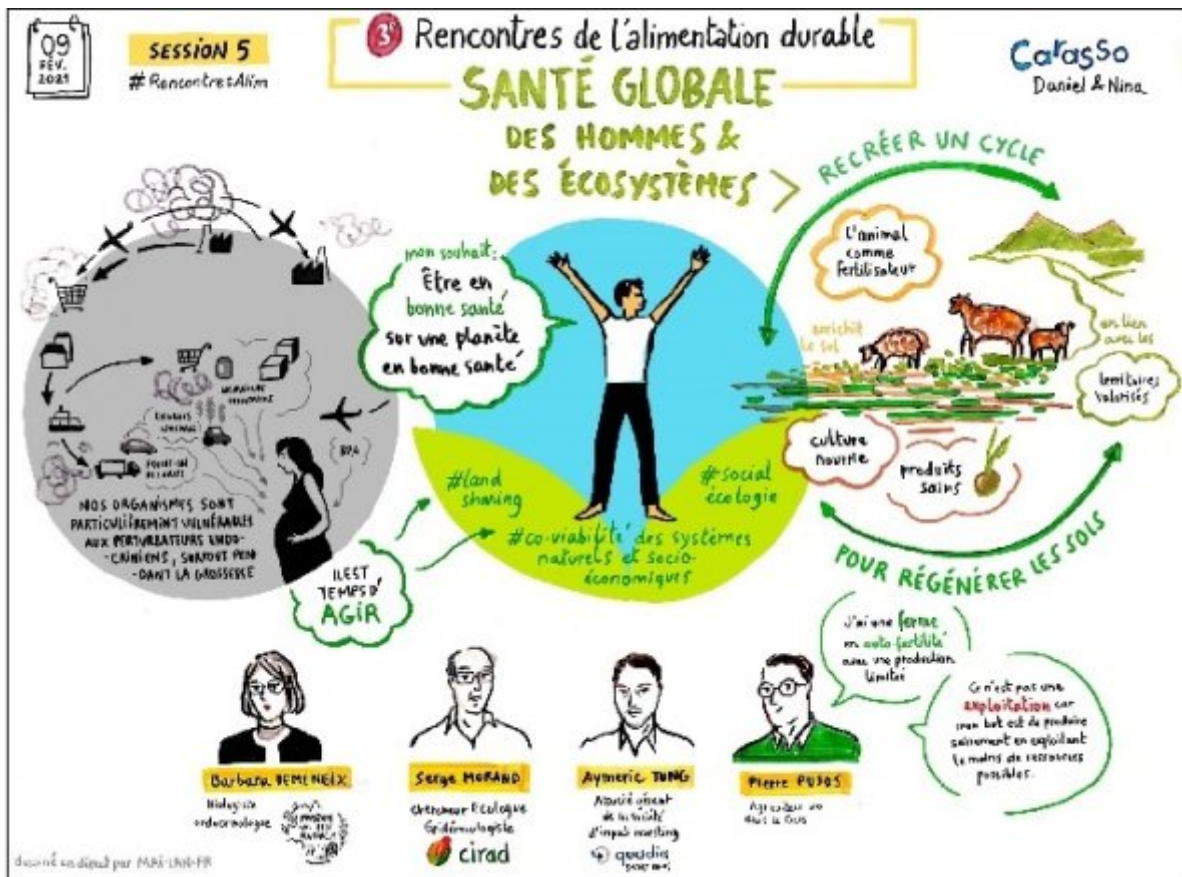
Figure 3 : Interdépendance entre les domaines de santé