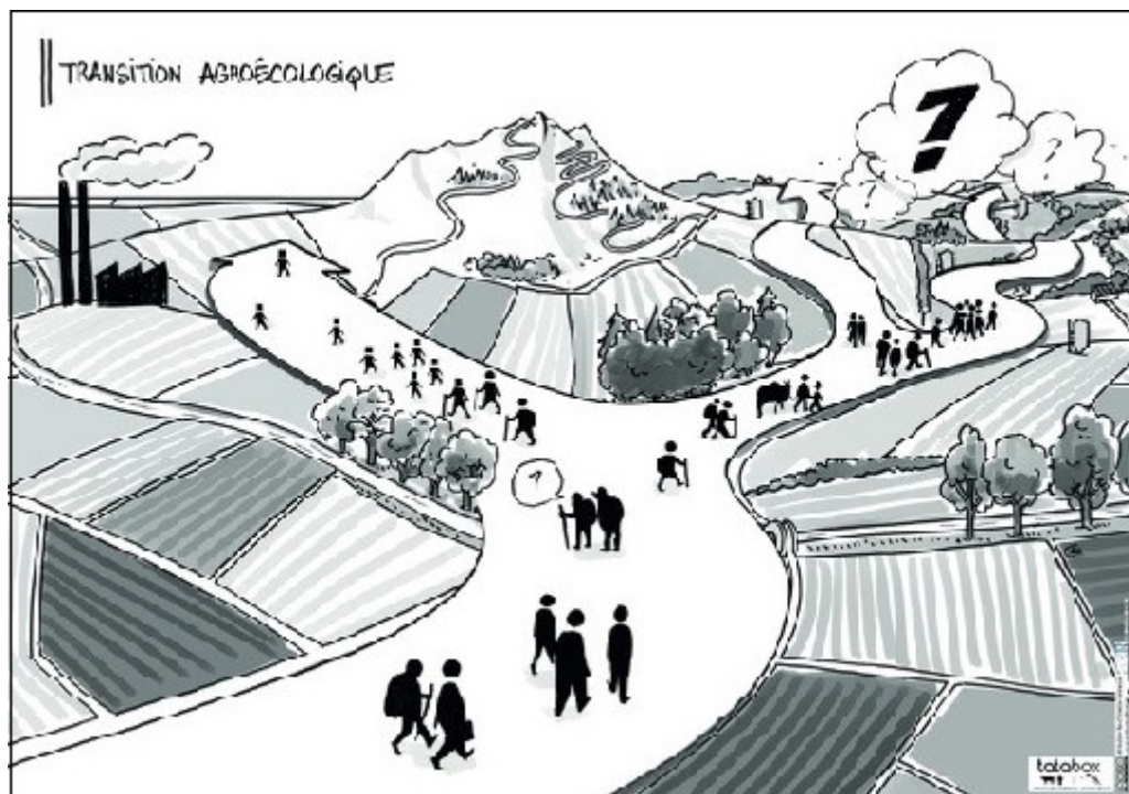
Figure 2 : Deux visions d'un système alimentaire durable

sont souvent considérés séparément dans les politiques publiques et comme incompatibles ou superflus dans les médias : « une agriculture plus propre conduirait à une diminution de la sécurité alimentaire » ; « notre agriculture est exemplaire et notre alimentation est la meilleure ». Nous terminons en montrant la nécessité de penser le changement de paradigme au niveau des territoires.